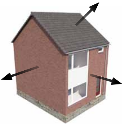
1 - bestaande geveldelen en dakpannen worden verwijderd

Centraal bij schilrenovatie staat het vervangen van de voor- achter – en kopgevel plus het dak van de woning. Bij een groot deel van het Nederlandse woningaanbod is dat een relatief kleine ingreep. Na het verwijderen van de bestaande gevels worden in één handeling nieuwe, prefab gevels geplaatst. Inclusief kozijnen, ramen en deuren; en inclusief alle doorvoeren voor kabels en leidingen. Indien een kruipruimte aanwezig is wordt de begane grondvloer van isolatie voorzien. Op die manier krijgt de woning een alles omsluitende, comfortabele en eigentijdse jas.