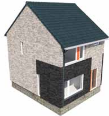
3 - de woning voorzien van een nieuwe gevel en dak