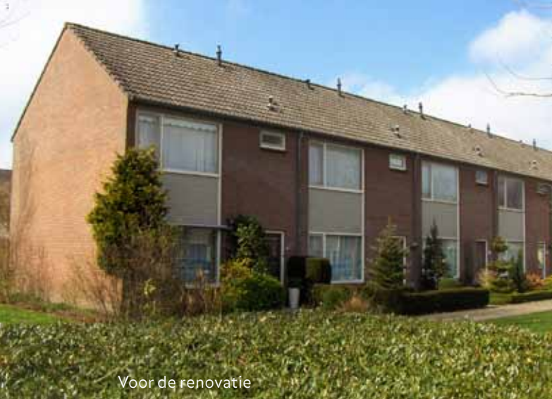
Voor de renovatie