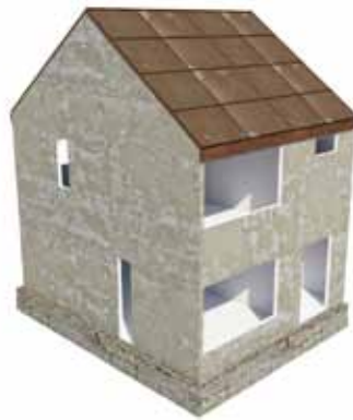
2 - de gestripte woning