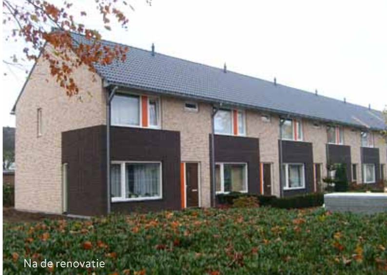
Na de renovatie